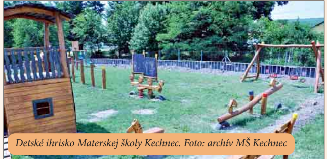
Detské ihrisko Materskej školy Kechnec.