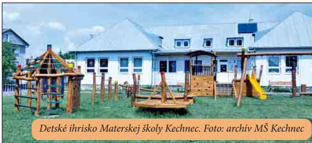
Detské ihrisko Materskej školy Kechnec.