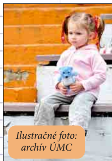
Ilustračné foto: archív ÚMC